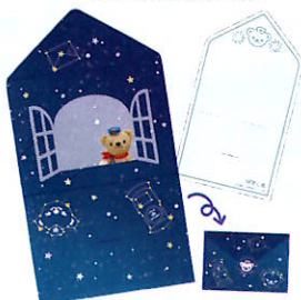
小学生以下 お手紙メモ