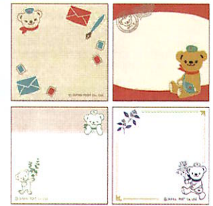
付せん紙4柄セット