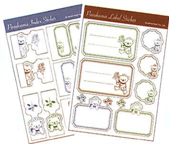
中学生以上 ステッカーセット