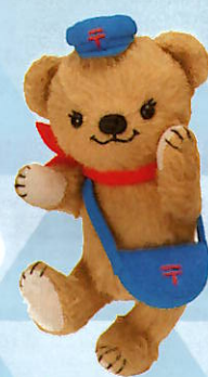
日本郵便のキャラクター ぽすくま © JAPAN POST Co., Ltd.

応募期間 2023年 6/5(月) ▶ 2023年 9/15(金) 当日消印有効